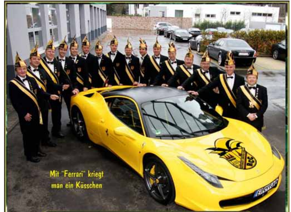
Mit "Ferrari" kriegt man ein Küsschen