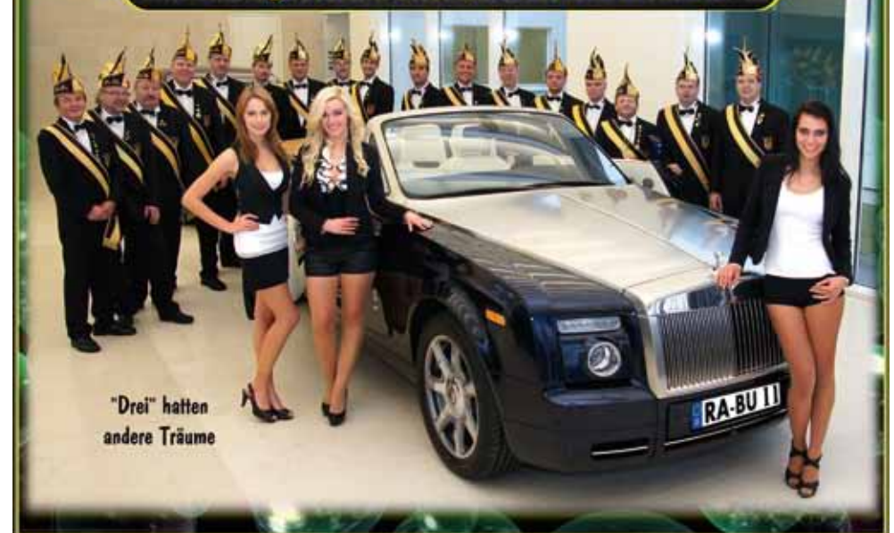
"Drei" hatten andere Träume